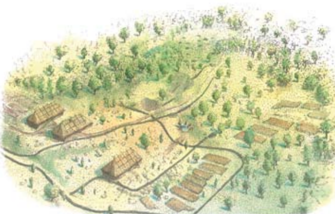
En av de bäst bevarade och sammanhållna järnåldersmiljöerna i Smedstad ligger i Domprostehagen och utgörs av en boplat, ett gravfält och två stora stensättningar. På bilden syns också en del av det hägnadssystem som är ursprung till det över 3 mil långa system av stensträngar som kan studeras i dagens Tinnerö. Illustrationen är en rekonstruktion av boplatserna.