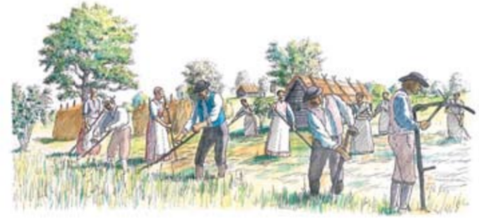
Ängsslätter på Tinnerö ängar pågick ända in på 1900-talet.

Tinnerös ekhagar och lövskogar har sitt ursprung i Tinnerö gårds vidsträckt ängsmarker som omnämns första gången i skriftliga källor från Gustav Vasas 1500-tal. Ända fram till 1905 slogs vidsträckt arealer kring Tinnerö med lie. Ängshöet förvarades i hölador ute på ängarna. På vintern kördes sedan höet med häst och släde den dryga vägen ner till Sturefors slott och gårdar.