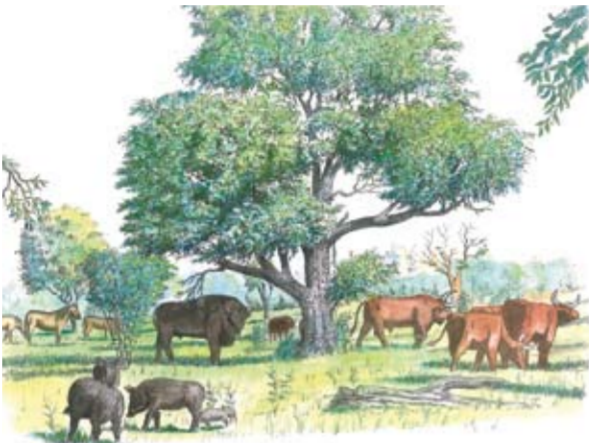
I det ursprungliga eklandskapet spelade vilda växtätare som visent och urox en avgörande roll för rikedomerna av djur och växter.

Många av Eklandskapets djur och växter har sitt ursprung i ett halvöppet lövskogslandskap dominerat av ek och hassel som utvecklades i Europa efter den senaste istiden. Det ursprungliga eklandskapet var mångformigt med öppna grässlätter, buskmark, lövlundar och solitära lövträd. Uroax, visenter och andra stora växtätare upprätthöll en mosaikartad struktur. De betade i luckor efter stormfällade träd och förhindrade trädförnygring så att gläntor med gräs och örter skapades.