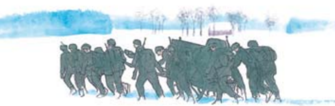
Under 1900-talet fungerade Tinnerö som militärt övningsområde, vilket bidragit till att områdets karaktär av äldre jordbrukslandskap bevarats.