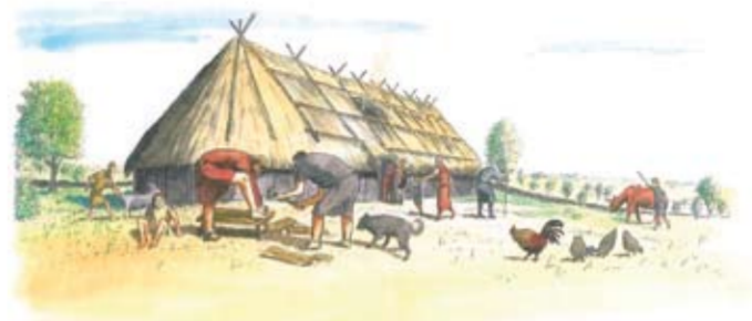
En rekonstruktion av den så kallade Hövdingaballen, belägen vid Tinnerö gård och det största långhuset i området. Under vintern då djuren stallades in fick människor och djur dela på utrymmet.

Djurens inomhusvistelse under vinterhalvåret skapade ett behov av foder, vilket ledde till ängsbrukets uppkomst och ett nytt slags jordbruk som väl beskrivs av uttrycket ”äng är åkers moder”. Tillgången på ängsmark styrde den åkerreal som var möjlig att odla eftersom åkern tillfördes stallgödsel från djuren, som fick sitt foder från ängsmarken. För att dryga ut vinterfodret skördades också löv från träd i ängs- och betesmarker. Ängsbruket med vidsträckt ängs- och betesmarker och hamlade träd kom att prägla Tinnerö och jordbruksbygden i resten av landet ända fram till 1800-talet.