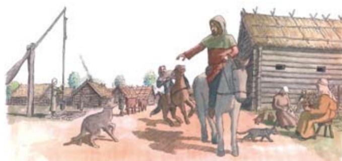
Tindra medeltida by uppstod någon gång under 1100-talet och låg då på kullen omedelbart norr om nuvarande Tinnerö gård. Förstadiet till denna by låg under yngre järnåldern ytterligare ca 400 meter åt nordväst.

Smedstad och Rosenkälla var två andra stora gårdar i området med en spännande medeltida historia. De har ägts av kungar och drottningar som i sin tur delat ut mark till andra makthavare. I de skriftliga källorna förekommer såväl höga militärer, biskopar och domprostar. Varken Smedstad eller Rosenkälla finns kvar idag, men två torp som tillhört Smedstad finns bevarade – Fröberget och Rytartorpet.