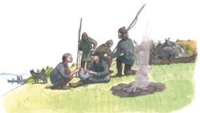
Vid Ancylussjöns strand fanns goda möjligheter till fiske och jakt av sjöfågel och sälar. I Domprostehagen har spår efter en eldstad från stenåldern påträffats.

var svedjebönder som flyttade sina odlingar i landskapet och bröt ny jord i lövskogen med hjälp av yxa och eld. Man började också hålla husdjur under den här perioden, då klimatet var varmare än idag. Det extensiva och småskaliga jordbruket kompletterades med jakt och insamling av nötter, bär, svamp och ätliga växter.