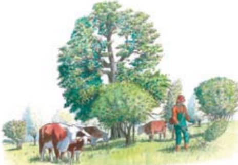
Betesdjur och naturvårdande insatser i form av gallring samt sly- och buskröjning är idag en förutsättning för Eklandskapets rika växt- och djurliv.

I det östgötska Eklandskapet söder om Linköping har många ekanknutna djur och växter kunnat leva kvar och en stor del av dem har här sin huvudsakliga utbredning i Sverige. Ansvaret för att säkra dessa arters överlevnad är stort. I arbetet med att bevara Eklandskapet och dess invånare är målet att så långt som möjligt efterlikna det europeiska ursprungslandskapets mosaik av miljöer och strukturer – det landskap vilket arterna ursprungligen är anpassade till.