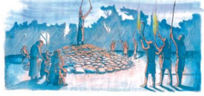
På Frökärrsbacken finns flera stora gravar från bronsåldern, anlagda i höga, väl synliga lägen.

Under bronsåldern ökade befolkningen något och människorna levde i större grupper. Jordbruk och framförallt boskapskötsel blev alltmer omfattande vilket resulterade i ett öppnare landskap. Under bronsåldern byggdes gravar som stora högar av sten på platser med vid utsikt över landskapet. Varje röse var grav över en person, vars kropp lades i en kista i mitten.