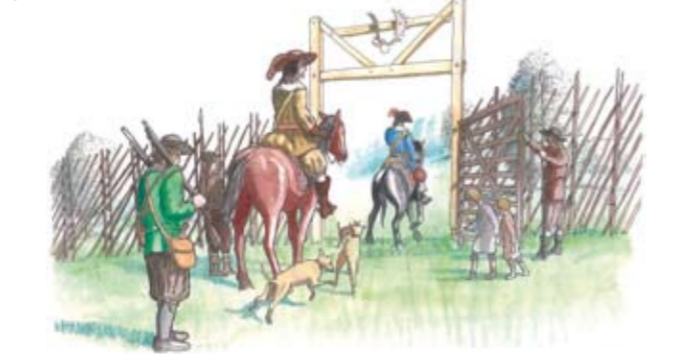
I den inhägnade djurgården nådde kunglig jaketrätt.

1606-1617 inrättade hertig Johan (hertig av Östergötland, son till kung Johan III) en djurgård med rådjur och dovhjortar i norra delen av området. Djurgården bestod under hundra år, därefter blev den landshövdingens lönejord. Från Djurgårdens verksamma tid som gård finns idag ett sättesmagasin och ett torp, kallat Djurgårdstorpet, bevarat.