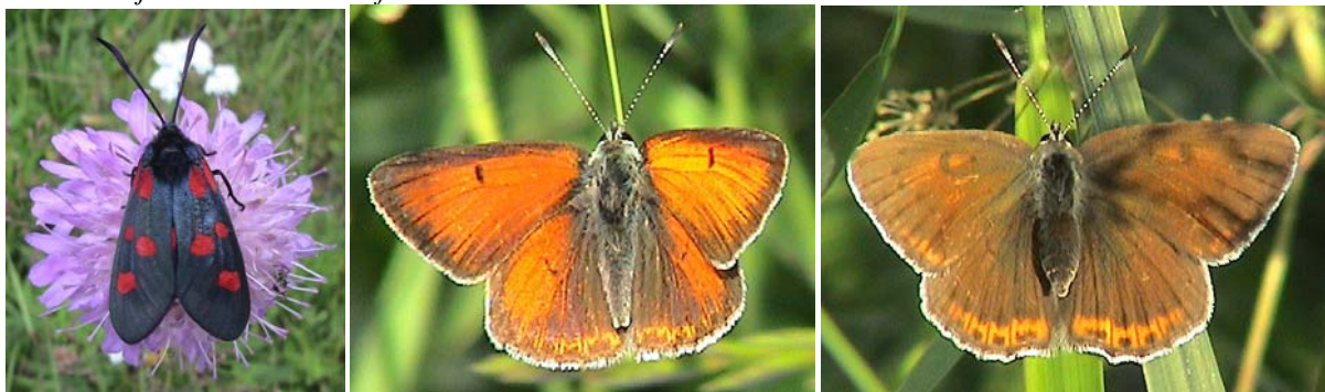
Bredbrämada bastardsvärmare till vänster, violettkantad guldvinge hane i mitten och hona till höger