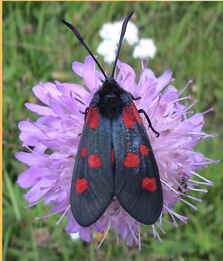
Bredbrämad bastardsvärmare, Anders Jörneskog