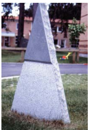
De fyra elementen Fanjunkargatan 51