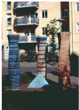
Uta Jacobs De tre pelarna tegel 1992 Innergård Hamngatan 19