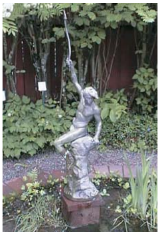
Ferrau reproduktioner 5 stycken i brons 1956 Örtagården