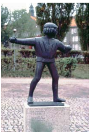
Ivar Lindecrantz Linköpingsdjäkn brons 1963 Berzeliiparken Platensgatan 20