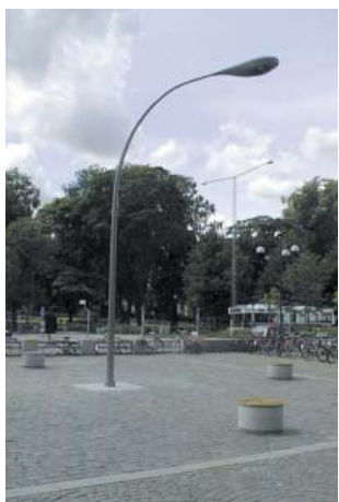
Konstnärgruppen Inges Idé Resande Ljus blandteknik 1999 Resecentrum