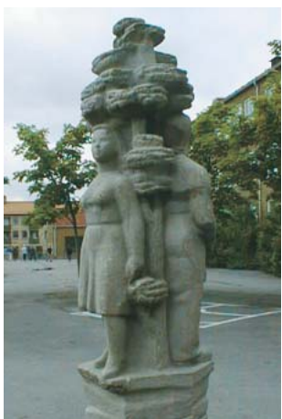
Emil Näsval Folkvisa stengöt 1949 Kungsbergsskolan Drottningtorget 1