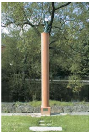
Åke Pallarp Karl IX med Wasakärven bese- grar Sigismund, den polska örnen brons