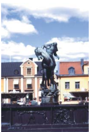
Carl Milles Folkungabrunnen med Folke Filbyter patinerad brons brunnskaret: svart och grå granit 1927 Stora Torget