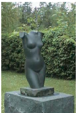
Carin Nilsson Skulpturer skilda material 1967 Carin Nilssons villa