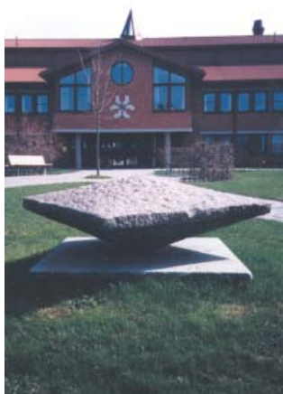
Kicki Stenström Fyrkant röd granit 1989 Origo huset