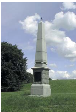
Minnessten Till minnet av slaget vid Stångebro 25/9 1598 sten 1898