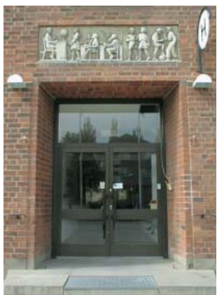
Emil Näsvalld Skolan stengöt 1953 Berzeliusskolan Gustav Adolfsgatan 25