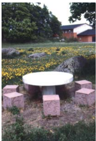
Auroras äng Bord