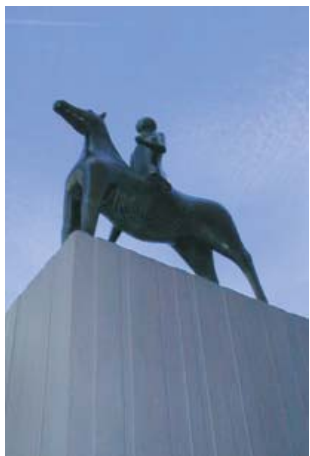
Sven Lundqvist Häst och ryttare brons 1961 Johannelunds cen- trum