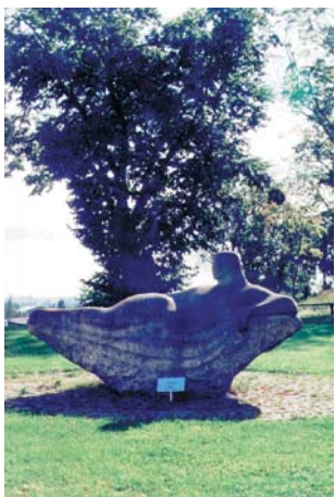
Tekniska verken, Stångebrofältet & Anders Ljungstedts Gymnasium