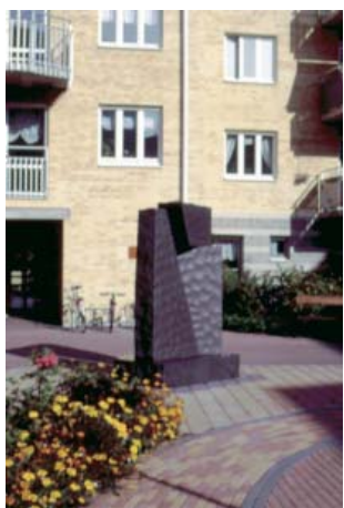
Uta Jacobs Vindarnas Port diabas 1992 Innergård Drottninggatan 2