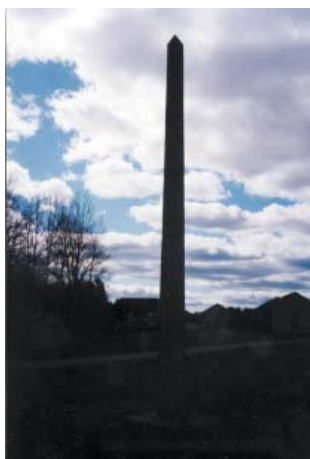
Auroras äng Obelisk