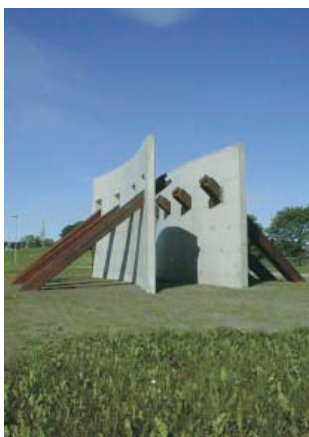
Wolfgang Peter Mentzel Stångebro Monumentet cement och järn 1998 Stångebroparken