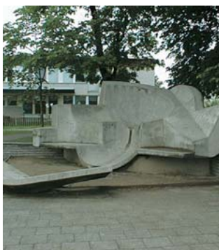
Ryd Per Göransson Lekskulptur betong 1974 Ryds Centrum