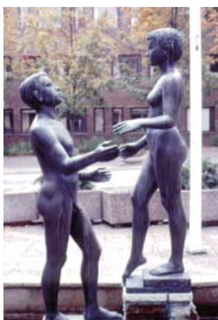
Emil Näsvalld Ungdomstid brons 1959 Ågatan 57