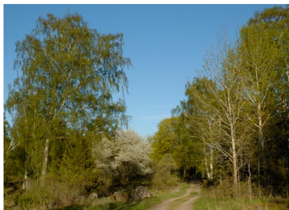
Hagmark på ändmorän vid Överby.

Landskapet norr om Askeby och Örtomta ligger i utkanten av slättbygden, där denna allt mer övergår i en mellanbygd. Talrika kullar med skog och hagmark bildar öar i den uppodlade lerslätten. Det är vackert och omväxlande och mer speciellt än vad man först kan tro. Men man ska nog vara geolog för att lägga märke till att alla höjder inte är "vanliga" kullar. Här har nämligen kanten av den senaste inlandsisen legat stilla en period under isavsmältningen. Att iskanten låg stilla innebar inte att isens påverkan på landskapet tog en paus. Mycket av