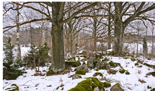
Vid Göstad bildar ändmoränerna markanta kullar i landskapet.

det grus och den sten som en inlandsis för med sig hamnar vid iskanten och eftersom kanten här låg stilla en längre tid ansamlades materialet, moränen, i högar framför isen. Dessa vallar, ändmoräner, är parallella med iskanten, alltså ungefär med en öst-västlig utsträckning.