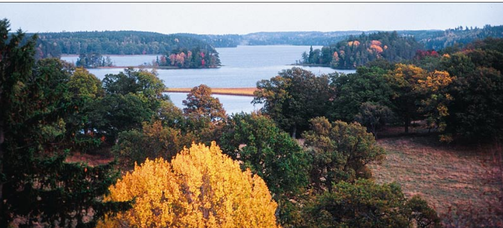
Höstutsikt över ekhagar och sjön Ärlången från berget i den norra delen av reservatet.