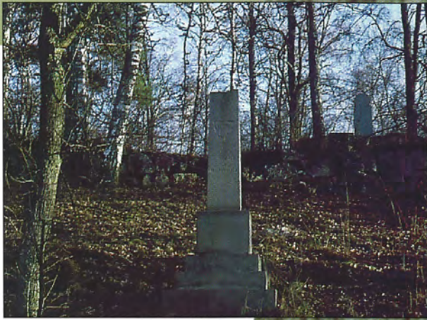
Nr 2 Birger Jarl