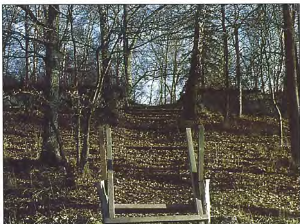
Trappa från Berga Slott