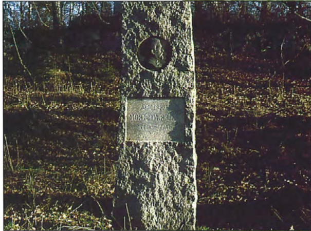
Nr 3 G. Alfred Nyström