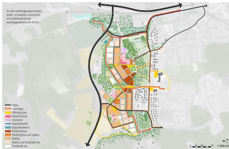
Figur 1. Utdrag ur strukturskiss för Himna, godkänd av samhällsbyggnadsnämnden 2019-04-24.

Den 24 april 2019 beslutade samhällsbyggnadsnämnden om start av två detaljplaner i västra Lingham. Detaljplanerna ska baseras på den stadsbyggnadsskiss som finns redovisad i utredningen "Himna – den hållbara stadsdelen". Stadsbyggnadsskissen visar en övergripande struktur och vision för området. Ambitionen är att skapa en hållbar stadsdel med varierad bebyggelse. Se figur 1.