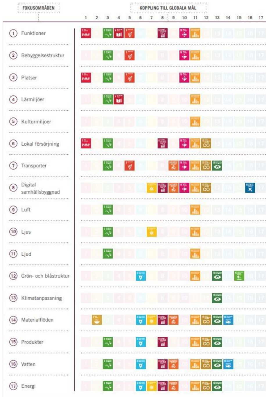
Figur 4. De sjutton fokusområden som ingår i processverktyget Citylab samt deras koppling till de globala hållbarhetsmålen.