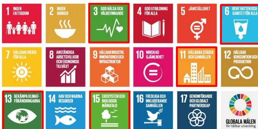
Figur 2. De sjutton globala hållbarhetsmålen som antogs av FN:s generalförsamling år 2015. Samhällsbyggnadsnämndens prioriterade mål är markerade med röd kant.

pågående mandatperioden har samhällsbyggnadsnämnden valt att prioritera fem av målen. Se figur 2.