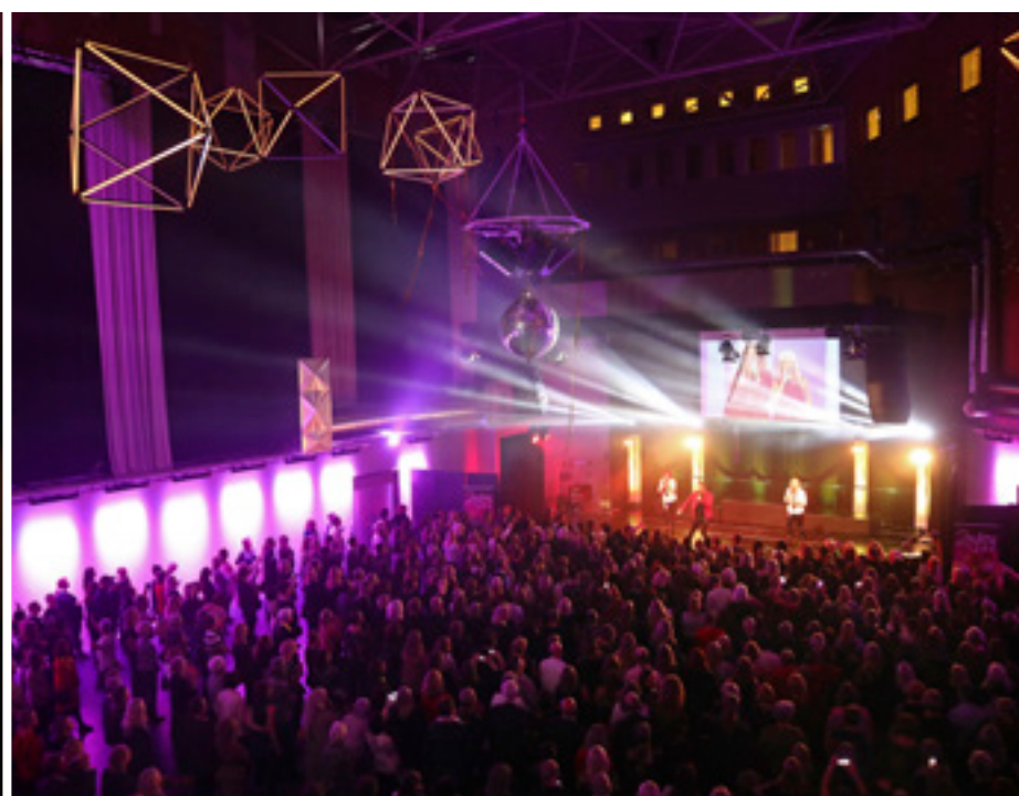
Gästerna bjöds på en timme show med Magnus Carlsson och 2nJoy.