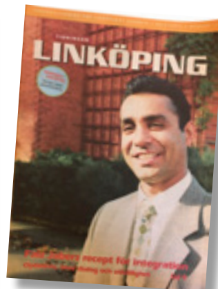
Tidningen Linköping, 1999.