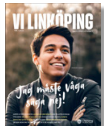
Nya tidningen Vi Linköping, som kommer ut i april 2019.