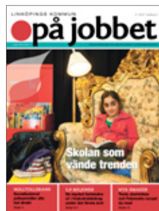
Tidningen På jobbet, 2013.