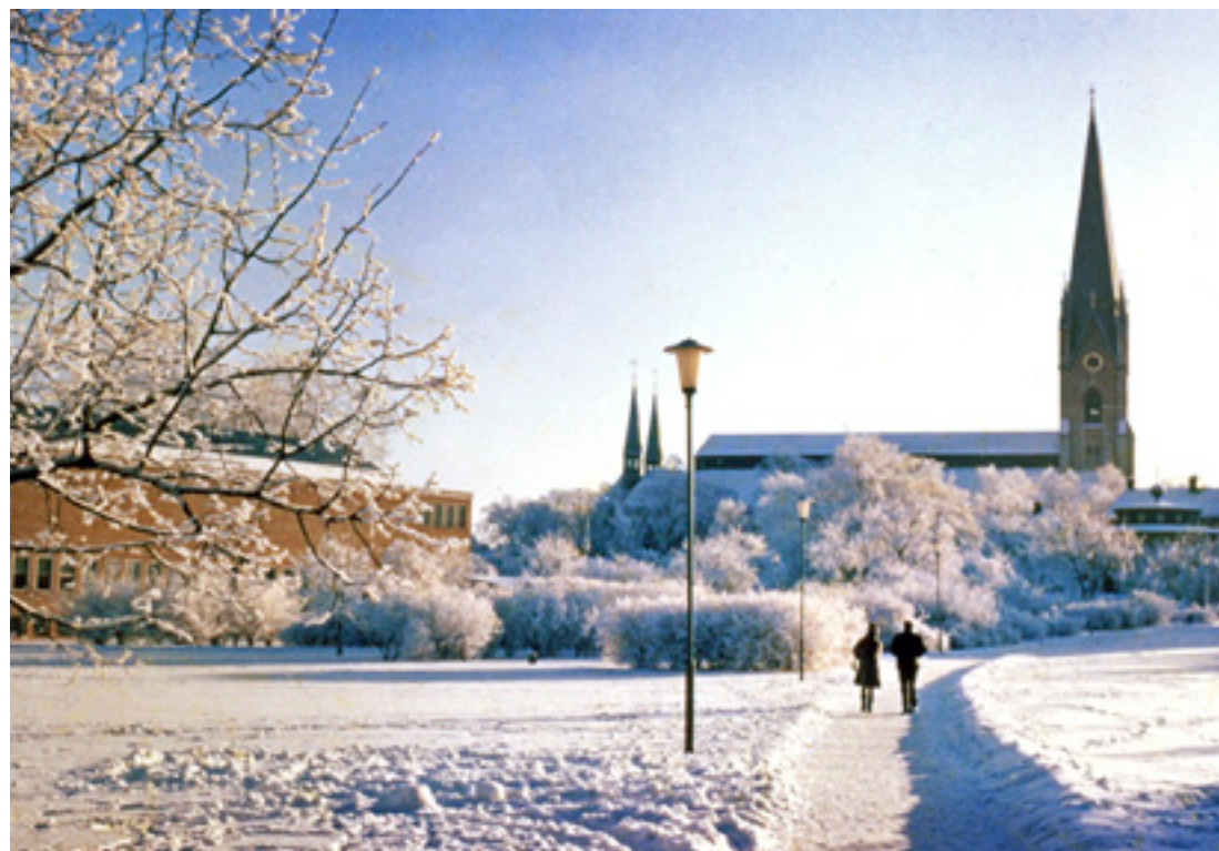
En krispig vinterbild från platsen där Konsert och kongress ligger idag. Bilden är tagen 1980. Mycket har förändrats i museiparken, men Linköpings domkyrka är lika prakfull då som nu.

Vill du se mer av Linköpings historia i bilder? Kika gärna in på Digitalt museum: https://digitaltmuseum.se/owners/S-BL