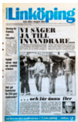
Tidningen Linköping, 1978.