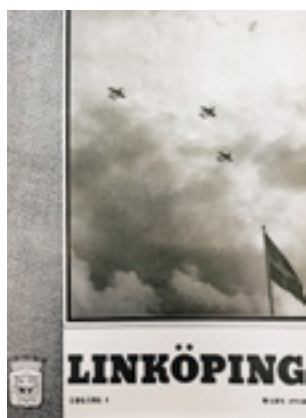
Allra första kommuntidningen gavs ut i mars 1950.