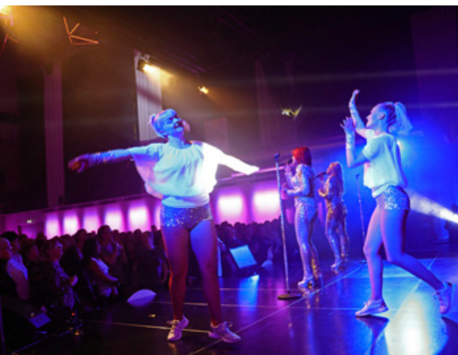
Fullt ös från scenen med popduon 2nJoy.