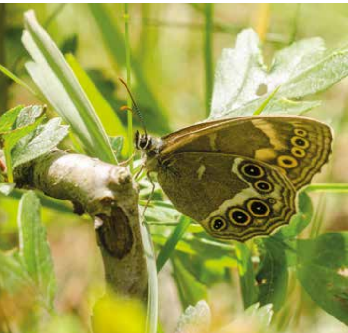
Dårgräsfjärilen, en kommunal ansvarsart.