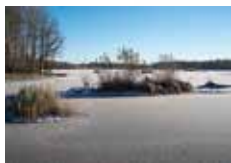
Tinnerö i vinterskrud.

NATURRESERVAT TINNERÖ EKLANDSKAP kultur och natur