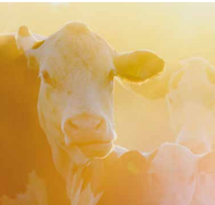
Upplev betessläppet på Halshöga gård.