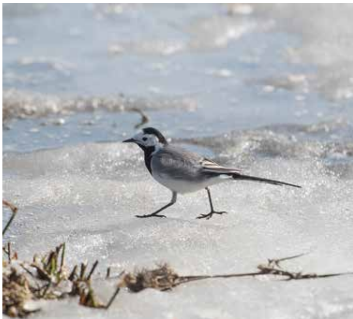
Övervintrande sädelsärta.