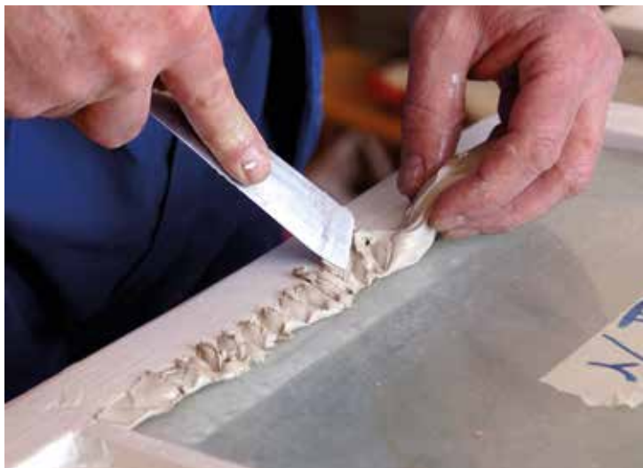
Fröberget under restaurering.

Arrangör: Linköpings kommun och Linköpings svampklubb. Samling: Parkeringen för Ullstämmaskogens naturreservat. Från Haningeleden sväng vid Korpvallen mot Slättbacka/ Kolbytteomon och kör ca 3 km. Sväng vänster mot Ullstämmaskogens naturreservat. Ett alternativ är via gång- och cykelvägen från Morgongatan. Kostnad: 20 kronor.