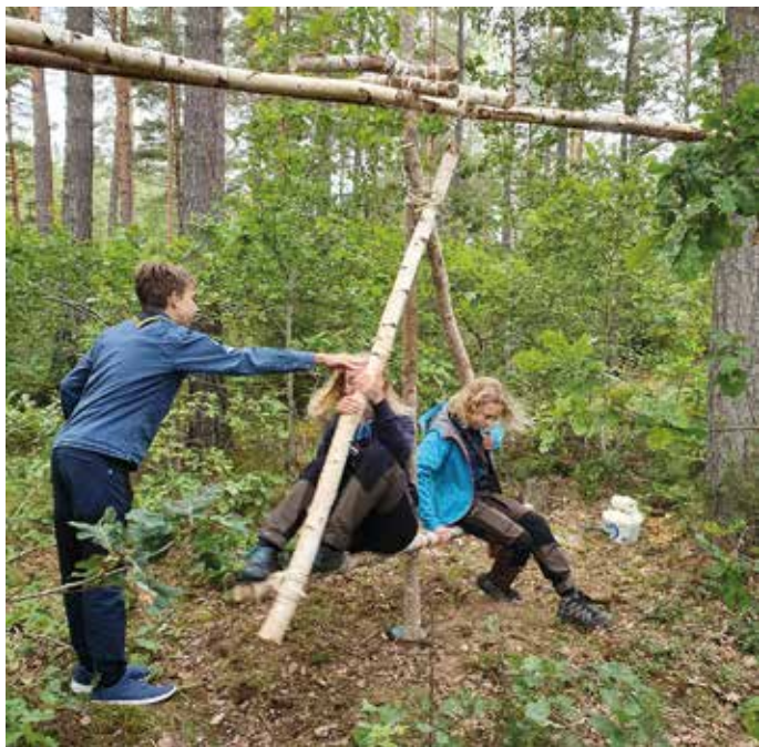
Upptäck Vallaskogen.