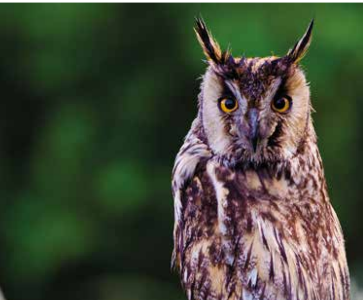
Hornuggla.