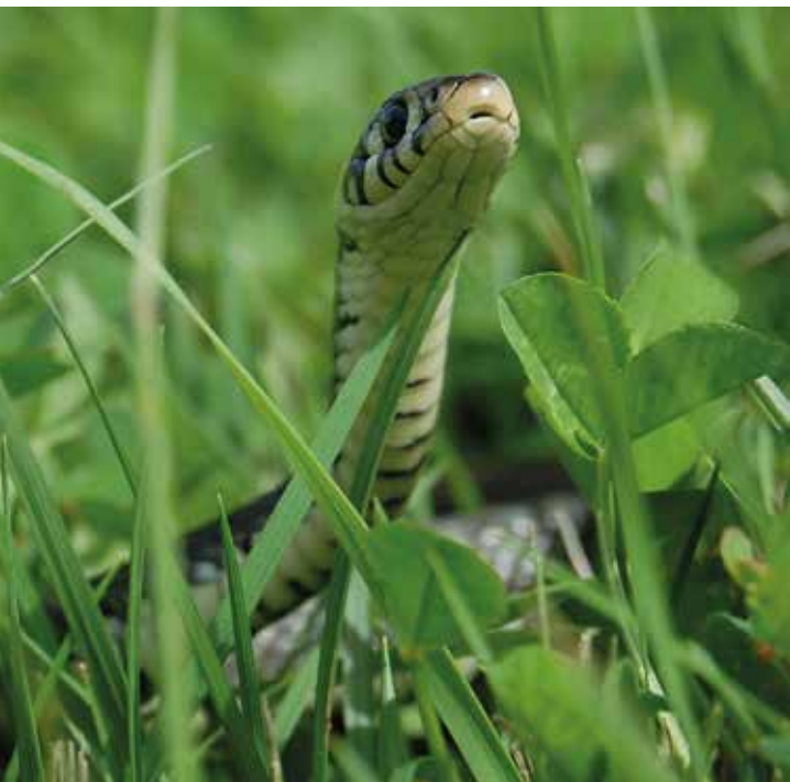
Nyfiken på att lära dig mer om ormar?