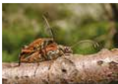
Två kärleksfulla Lundbockar.