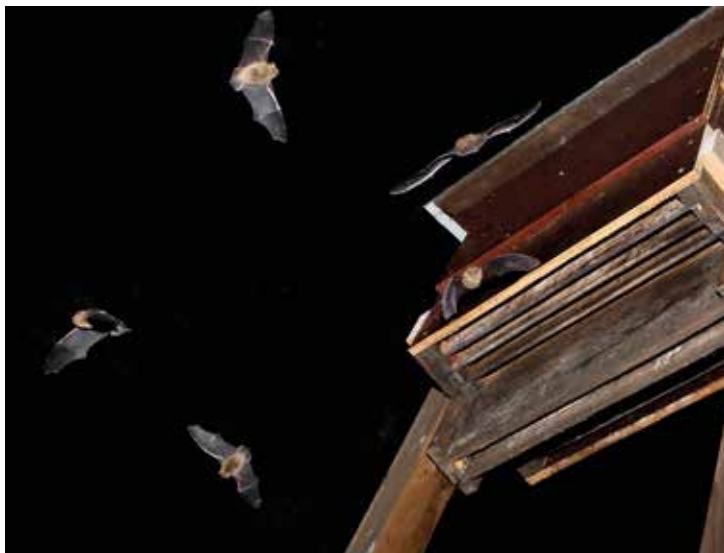
Flygande dvärgfladdermöss.