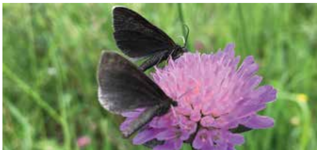
Sotmätare som svärmar till en åkervädd.