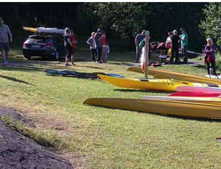
Följ med på en kajaktur i Viggeby naturreservat.

Upplev Linköpings skärgårdsreservat från sjön via kajak. Både vana och ovana paddlare är välkomna. Turen tar cirka 3 timmar och inleds med kort instruktion från Linköpings kanotklubb. Kommunekolog Gunnar Ölfvingsson (0706-98 86 21) guidar. Bindande föransmälan senast tisdag 9 juni, 013-20 60 00. Minimiålder 12 år. Medtag oömma kläder, ombyte, handduk och fika. Arrangör: Linköpings kommun och Linköpings kanotklubb. Samling: Viggebysandsbadet, Viggeby naturreservat. Kostnad: 100 kronor inklusive kajak med tillbehör.