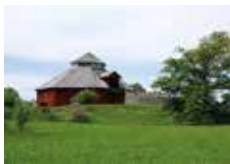
Rundlogen vid Tinnerö gård.