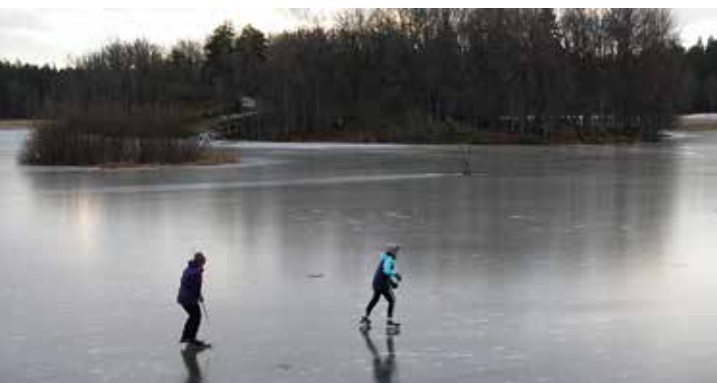
Skridskotur i vinterlandet.