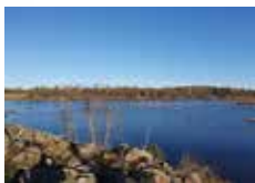
Höst vid Rosenkällasjön.