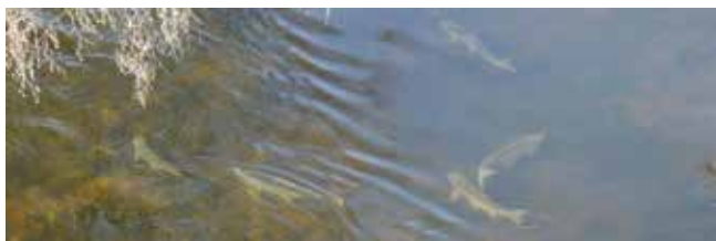
Leker aspen?