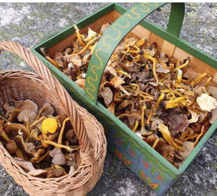
Svamptur i skogen.