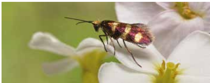
Barrskogskäkmal, Foto: Tobias Ivarsson