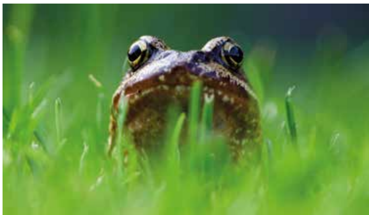
Har grodor och vattensalamandrar vaknat?