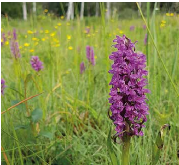
Blommande orkidéer.