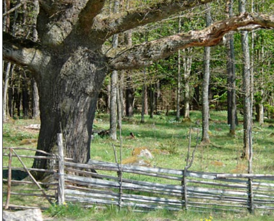
Skogsbete i Vallaskogen.

Vallaskogens naturreservat är ett barrskogsdominerat strövområde som är flitigt utnyttjat av linköpingsborna. Den norra delen vid Gamla Linköping har prägel av äldre kulturlandskap. Här betar kor och får av gamla lantraser mellan träden. En höлада i äldre stil och de långa trögärdesgårdar som kantar grusvägarna bidrar till den ålderdomliga atmosfären. Stora delar av skogen i övrigt lämnas för fri utveckling.