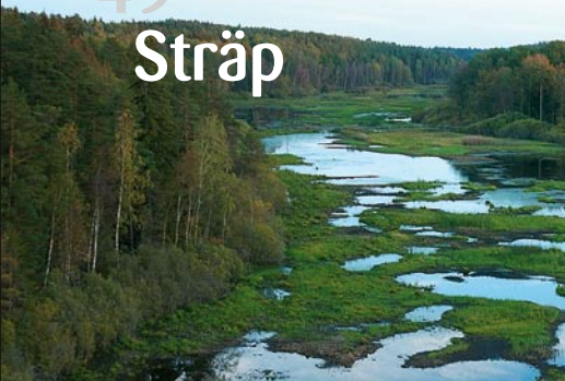
Vy över Sträp efter restaureringen.

En flera miljoner år gammal spricka i urberget är idag grunden för en myllrande fågelsjö. För hundra år sedan försökte man torrlägga sjön, men nu har Sträp väckts till nytt liv.