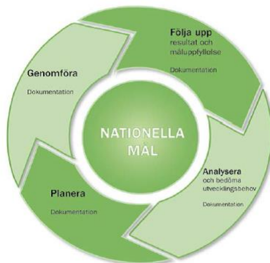
Figur 2. Hämtad från "Främja, förebygga, upptäcka och åtgärda – Hur skolan kan arbeta mot trakasserier och kränkningar", Skolverket 2014, sidan 57.

I det beskrivna arbetet ska ingå att ta fram vilka typer av kartläggningsmetoder som ska ligga till grund för kommande kartläggningar. När detta är genomfört ska arbetet följa det kvalitetshjul som härstammar från Skolverkets allmänna råd för systematiskt kvalitetsarbete i skolan – se figur 2 nedan. I denna process är både elever och personal viktiga resurser.