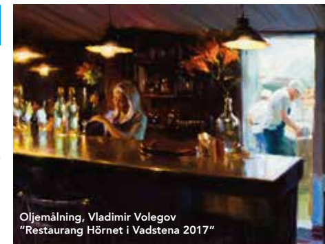
Oljemålning, Vladimir Volegov "Restaurang Hörnet i Vadstena 2017"

För aktuella utställningar och information besök www.melefors.com