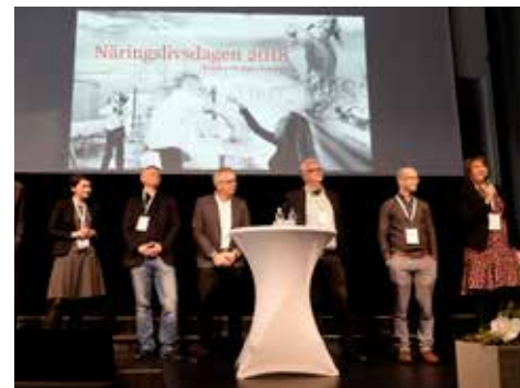
Kommunens politiker och tjänstemän på Näringslivsdagen 2018 för att svara på näringslivets frågor.

Det är därför Linköping med fog kan kalla sig staden där idéer blir verklighet.