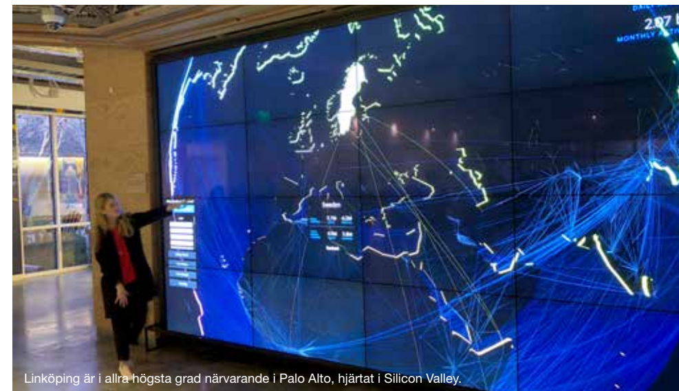
Linköping är i allra högsta grad närvarande i Palo Alto, hjärtat i Silicon Valley.

Linköpings kommun har kontakter med städer och regioner över hela världen.