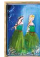
Emilia Linderholm Oljemålning