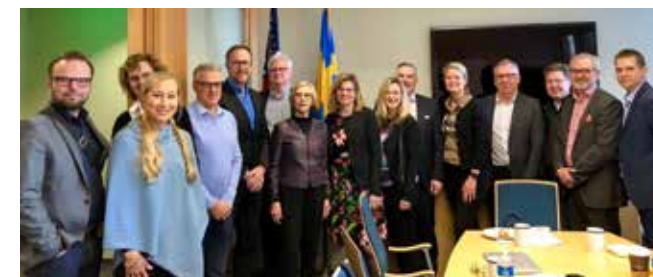
Delegationen från Linköping på besök i Palo Alto, USA. Kommunen öppnar dörrar dit och till fler städer och regioner för näringslivet.

I början av 2018 reste den första delegationen med företag till Silicon Valley.