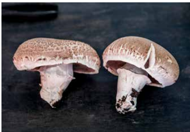
Med avancerad reglerteknik odlas svampar av högsta kvalitet.

Östgötasvamp har redan vunnit flera priser. Det lär komma fler i framtiden.