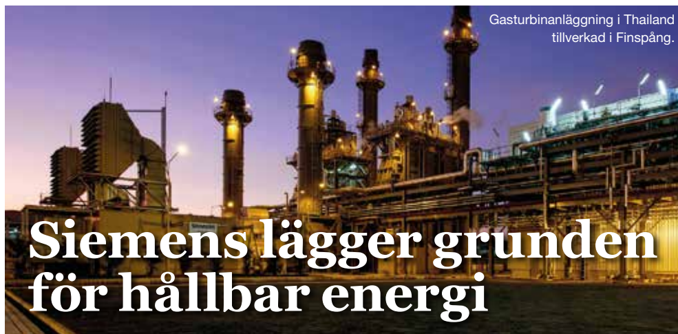
Gasturbinanläggning i Thailand tillverkad i Finspång.