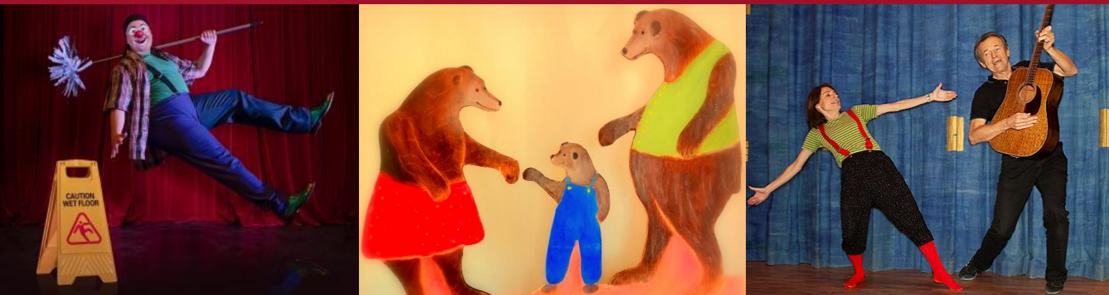
Bilder: Teater Imba, Korpsteatern, Fia & Stefan