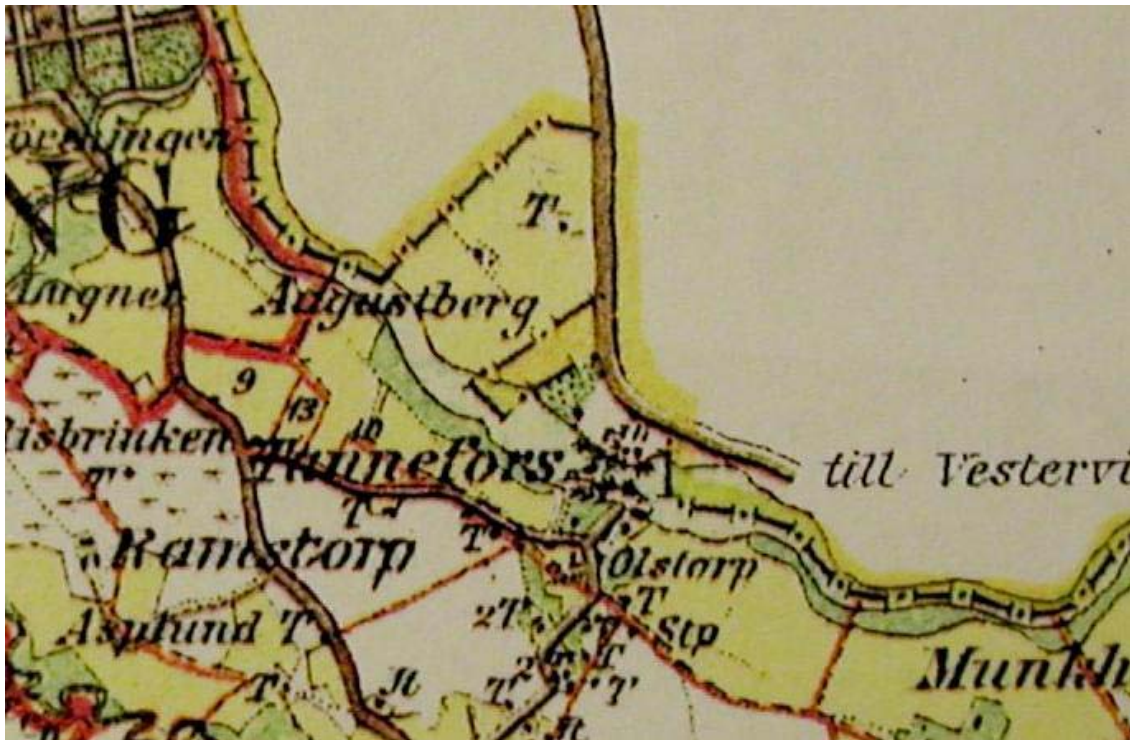
Utsnitt ur 1878 års ekonomiska karta för Hanekinds härad. Tannefors by i centrum. De tomma ytorna öster om Stångån var belägna i Åkerbo härad. Gränsen mellan Linköpings stad och Sankt Lars socken är markerad med en tjock röd linje.

Tannefors by sammanfaller inte geografiskt med den moderna stadsdelen Tannefors. Byn, som bestod av tre hemman, ett tiotal kvarnar samt diverse andra jordområden, var till större delen belägen på Stångåns västra sida. Bebyggelsen var på västra sidan koncentrerad till det område som i dag är beläget mellan Nattstuvugatan och Söderleden; dessutom låg flera kvarnar och torp på de smala landremsor som hörde till byn på Stångåns östra sida. De tre hemmanen i byn bar namn som lever vidare i ett stadsdelsnamn och två gatunamn: Hedjegården, Ödegården och Nattstuvugården.