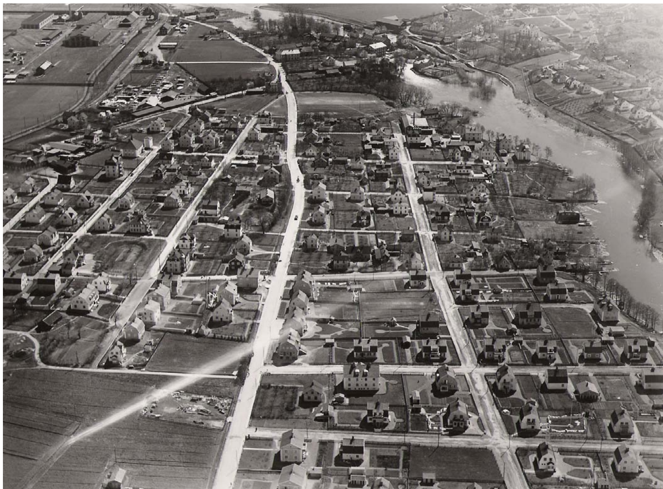
Flygfoto över Augustberg, Åkersberg och Lindesberg söderut mot Tannefors vid middagstid 3 maj 1927. Den breda gatan i bildens mitt är Nya Tanneforsvägen; mellan den och Stångån Arbetaregatan; parallellgatan till vänster är Augustbergsgatan. Den låga bygganden på höjden t.v. om Nya Tanneforsvägen mellan bilen och den hästdragna lastvagnen är det av August Curman uppförda Augustberg. Strax söder om huset går Curmansgatan ned mot Stångån.